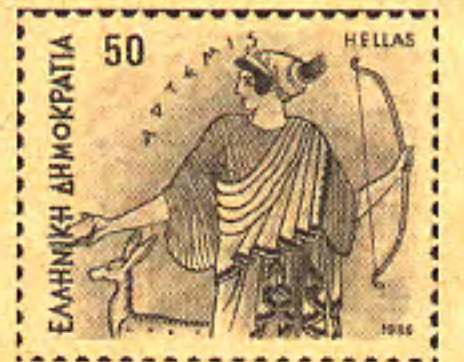
アルテミシア肖像 ギリシャ政府発行切手

Artemisia absinthiumの種名は「聖なる草」を意味するエルブ・アブサントに由来、