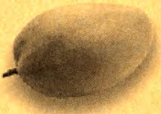
近大のマンゴー「愛紅」

三十年ほど前、私はタイのドンムアン空港に降り立ちました。タラップを降りると、これまで経験した事がない独特の臭いがあり、異国に來たという実感を抱きました。これが私の初めての海外旅行で、空港には銃を持った兵士が立っており、これから大丈夫かなという気持ちになったのを覚えていきます。当時、私は京都大学の助手をしており、ブドウの着色等の研究を行っていました。それが急きょ半強制的な代役として、東南アジアの農村調査メンバーに加わる事になりました。その頃は、外国の情報などは今ほど豊富でなく、心中では熱帯などへは行きたくないと思っていました。出発前は食事や病気の事など不安だらけ…。